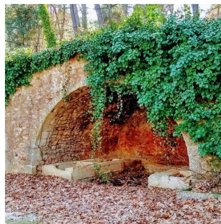
La Fontaine des naïades

Site incontournable du village, le sentier des ogres est une véritable curiosité géologique, les carrières aux multiples couleurs naturelles, contribuent à faire de Roussillon un des sites le plus renommé du Lubéron.