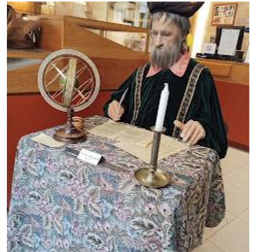
Maison de Nostradamus

La ville est fière de l'enfant du pays, Nostradamus, dont la maison natale est visible dans la rue Roche, le long des restes de l'enceinte du 14 ème siècle.