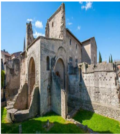
Hôtel de Sade

Durant cette visite, nous aurons l'occasion de déambuler dans les ruelles de la ville et de découvrir divers monuments, hôtels particuliers (tels ceux de Mistral-de-Mondragon et Sade, place Favier) et quelques éléments médiévaux.