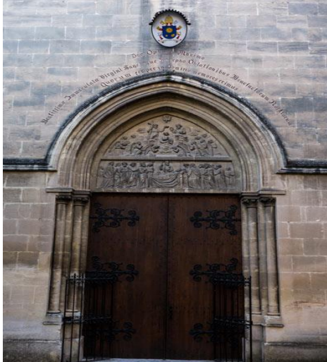
Entrée de l'abbaye

Notre visite débutera à 10 H avec la Maitresse de Maison qui sera notre guide. La visite se fera en 2 parties.