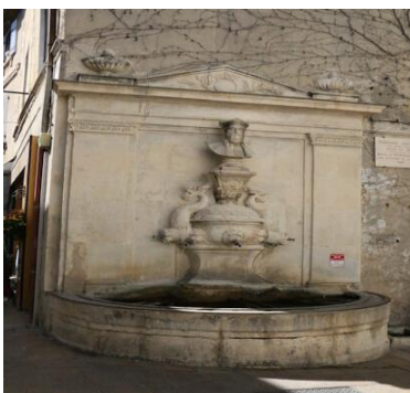
Fontaine de Nostradamus

Une fontaine à son effigie (19 ème siècle) s'élève à l'angle des rues Carnot et Nostradamus.